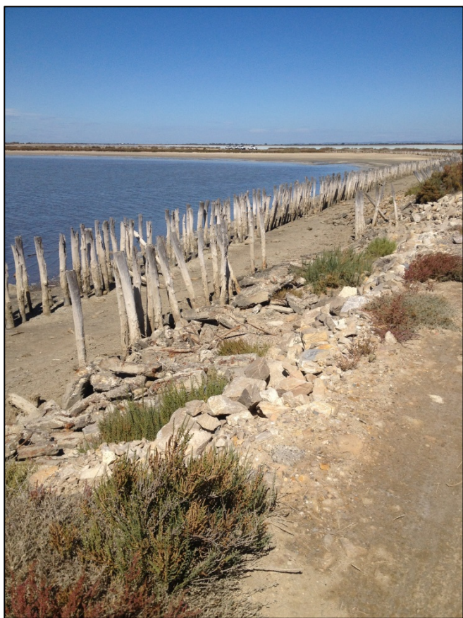
FIGURE 1: APERÇU DU SITE D'IMPLANTATION DE LA PLATEFORME DIGUE 2020 – PARC NATUREL DE CAMARGUE

Le choix du site pour l'implantation de la plateforme a été identifié après étude des différents critères listés plus haut et validé auprès des acteurs locaux du Parc Naturel Régional de Camargue fin Mars 2018. L'ouvrage sera implanté sur la digue à la mer existante illustrée ci-contre, à proximité des étangs du Fangassier et du Galabert. Il est conçu pour être parfaitement intégré et très peu visible dans un environnement naturel exceptionnel et très protégé.