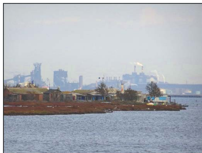
FIGURE 3: PORT-SAINT-LOUIS DU RHONE

Les deux villes sont comparables dans leur structuration socio-économique (revenus et seuil de pauvreté), mais contrastées dans leur type d'exposition à la submersion (totale vs partielle), et leur activité économique principale (industrielle pour Port-Saint-Louis, touristique pour Fréjus). Bien qu'elles n'aient pas le même nombre d'habitants, le même nombre de personnes est concerné en cas d'inondation par submersion marine : environ 9 000 personnes (la totalité des habitants de Port-Saint-Louis et 20 % des habitants de Fréjus).