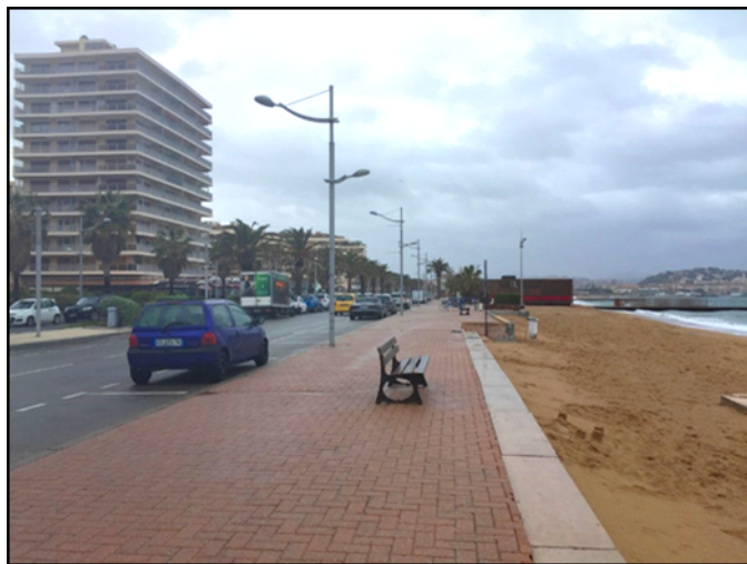
FIGURE 4 : FREJUS